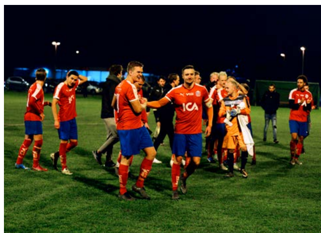
Nöjda spelare efter hemmaseger i tredje kvalmatchen, en mild oktoberkväll på Brunnbyvallen med mycket publik.

EFTER EN MÅNADS välbehövlig vila efter den extra långa säsongen börjar nu vinterträningen på konstgräset i Lerberget. Till våren är publiken välkommen till Brunnbyvallen igen.