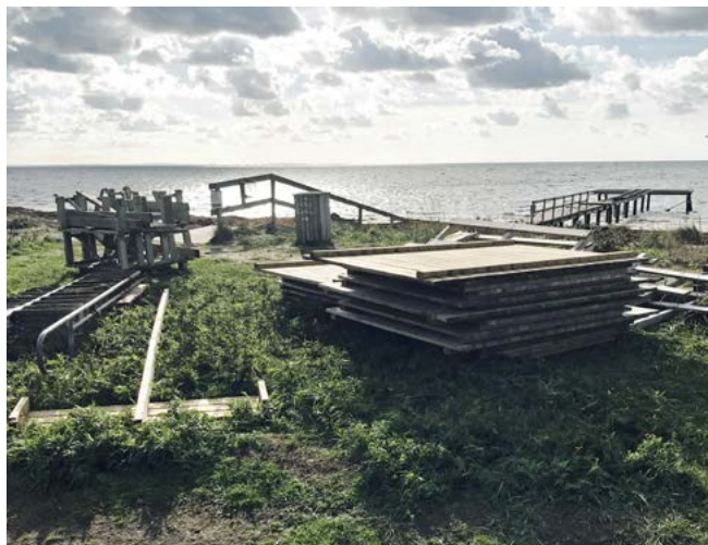
Bryggans stomme ser ut att ha klarat sig efter stormen Knud, men till nästa säsong krävs en del reparationer på flakarna.

Stormen Knud 21–22 september blev lugnare än befarat i Skåne, inte ens en storm faktiskt. På Hallands Väderö uppmättes som mest 22 sekundmeter i byarna, vid storm är vindhastigheten 24,5 – 28,4 sekundmeter.