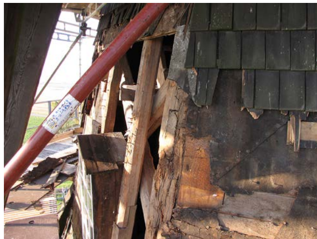
Omfattande rötskador fanns under de gamla spånen och lumppappen.

VI HAR TILLSAMMANS med Kyrktak lagt ner ett omfattande arbete att byta skadat undertak och byta rötskadade delar. För att få ett ytterskal som ska hålla i många år har vi också plåtskott tak på fönster och dörrar samt plåt på fönsterfoder. Runt dörrarna har vi