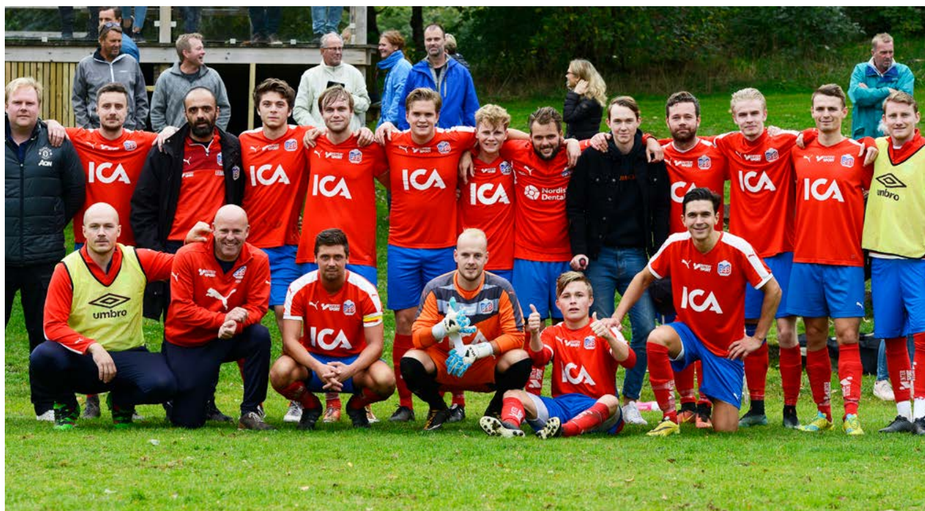
Brunnby FF/Väsby FK, A-laget med ledare 2018.